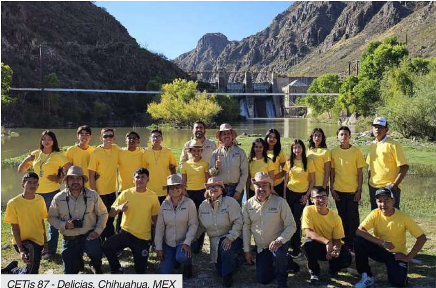
CETis 87 - Delicias, Chihuahua, MEX