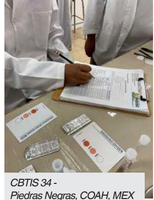
CBTIS 34 - Piedras Negras, COAH, MEX