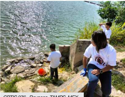
CBTIS 276 - Reynosa, TAMPS, MEX