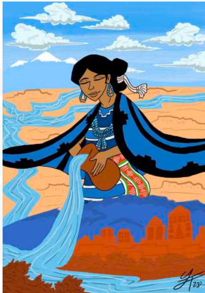
USA - Navajo Preparatory School Farmington, NM,