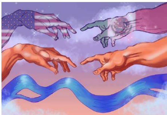
Hot Springs High School, Truth or Consequences, NM, USA