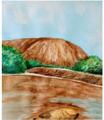
CBTIS 128 - Ciudad Juárez, CHIH, MEX