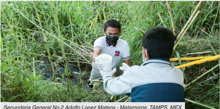
Secundaria General No.2 Adolfo Lopez Mateos - Matamoros, TAMPS, MEX