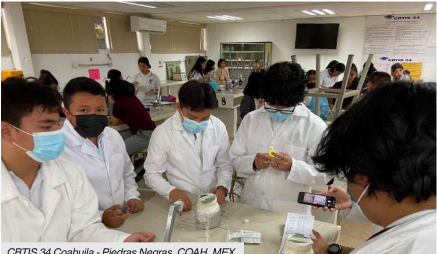
CBTIS 34 Coahuila - Piedras Negras, COAH, MEX

Favor de consultar la página 6 para un cronograma detallado de las fechas de entrega.