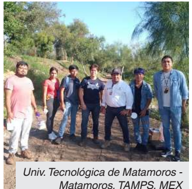
Univ. Tecnológica de Matamoros - Matamoros, TAMPS, MEX