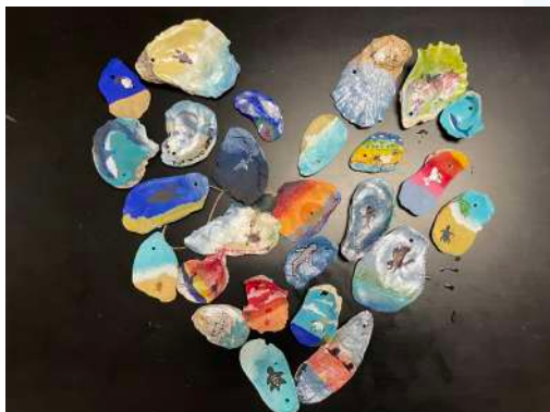
Gregory Portland Middle School - Portland, TX, USA