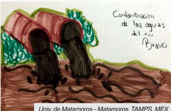
Univ. de Matamoros - Matamoros, TAMPS, MEX