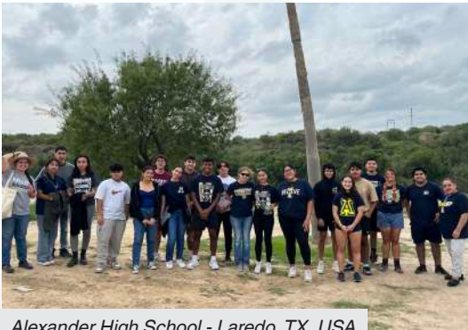
Alexander High School - Laredo, TX, USA