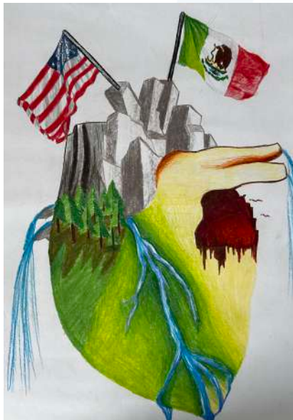
MEX - CETis 87 Delicias, CHH