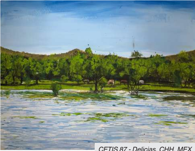
CETIS 87 - Delicias, CHH, MEX