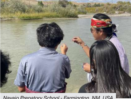
Navajo Preparatory School - Farmington, NM, USA