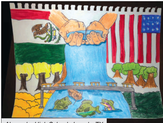
Alexander High School - Laredo, TX