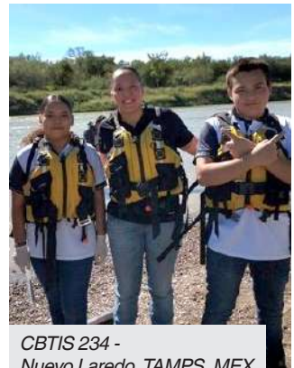
CBTIS 234 - Nuevo Laredo, TAMPS, MEX